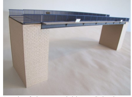
LT32: Straßenbrücke 32,5x10,7x2,3cm 34,90 Euro

Brückenfarbe grau mit blauen Geländern. Incl. 2 Widerlager 8 x 4,3 x 11cm (Sandstein gelb)