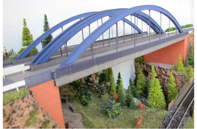
LB48-2: Autobahnbr. blau 48,5x16x10cm 99,95 Euro

Zum Lieferumfang gehören die abgebildeten Widerlager 16 x 4 x 10cm in orangeroter Ziegelsteinoptik