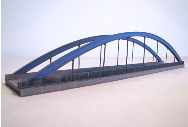
LB48: Straßenbrücke blau 48,5x8x10cm 52,90 Euro

Zum Lieferumfang gehören 2 Widerlager 8 x 4 x 10cm in orangeroter Ziegelsteinoptik (siehe die Abbildung bei LB48-2)