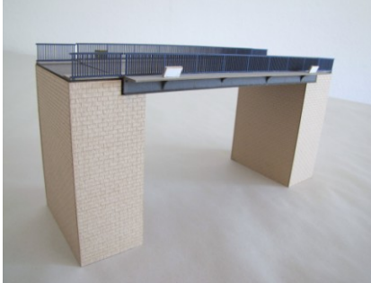
LT18: Straßenbrücke 18,6 x10,7x2,3cm 24,90 Euro

Brückenfarbe grau mit blauen Geländern. Incl. 2 Widerlager 8 x 4,3 x 11cm (Sandstein gelb)